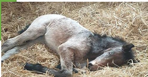
Jitanas fol Magoo